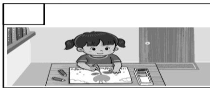
(1) 萱萱說自己喜歡畫畫