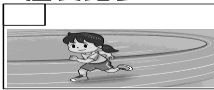
(3) 郁兒說自己擅長跑步